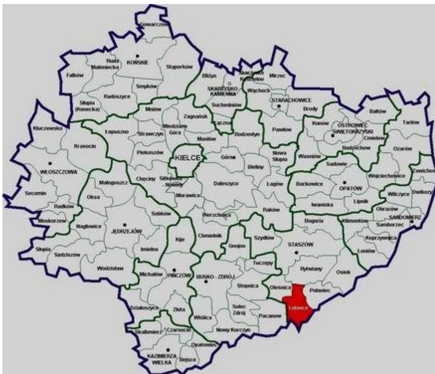
Rys. 1. Położenie Gminy Łubnice na tle mapy województwa świętokrzyskiego